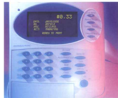
D-SPARKは操作がシンプルで簡単。初めてのユーザーにもすぐお使いいただけます。見やすいディスプレイで操作の状況が一目でわかります。