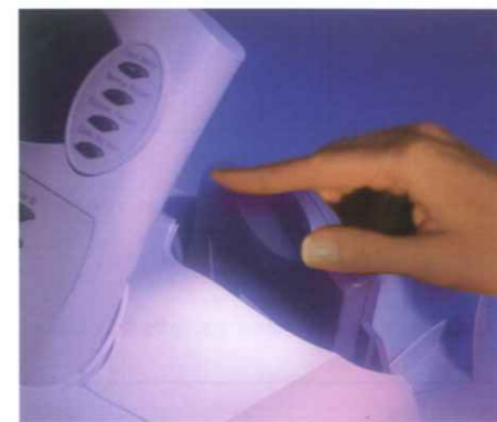
インクカートリッジはワンタッチで出し入れできます。