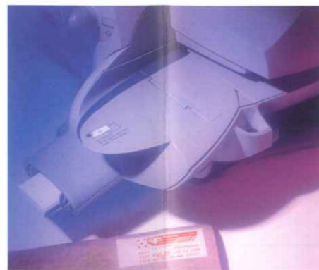
ラベルにより、大型郵便物や小包も処理します。